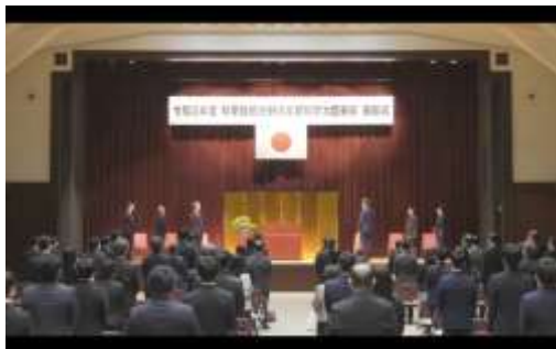
授賞式の様子 (オンライン)