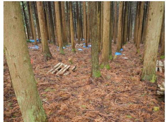
写真 A 0 層除去3年半後の試験地(スギ)

【方法】 平成24年11~12月に、一関市内の2試験地に40m×40mのA 0 層除去区と非除去区を設けました。各試験地の樹種は、試験地①がスギとアカマツ、試験地②が広葉樹です。除去後に積もった落葉は、取り除かず放置しました。