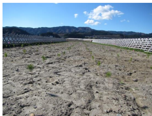
写真 調査箇所の状況 (Mブロック)

植栽基盤土壌の物理性及び化学性の調査結果を表に示しました。化学性では、ECが低く養分不足と評価されましたが、造成緑化地のECは低いのが通例で、問題は少ないとされています 3) 。物理性では、固結層は確認されませんでした。6測点のうち5測点で膨軟すぎとなっていました。また、透水性で不良と評価された測点(3測点/5測点)がありました。膨軟な状態は今後解消されると考えられますが、調査では小規模な滞水跡が確認されたため、引き続き土壌物理性と植栽木の調査を行います。