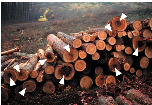
カラマツ根株心腐病の被害