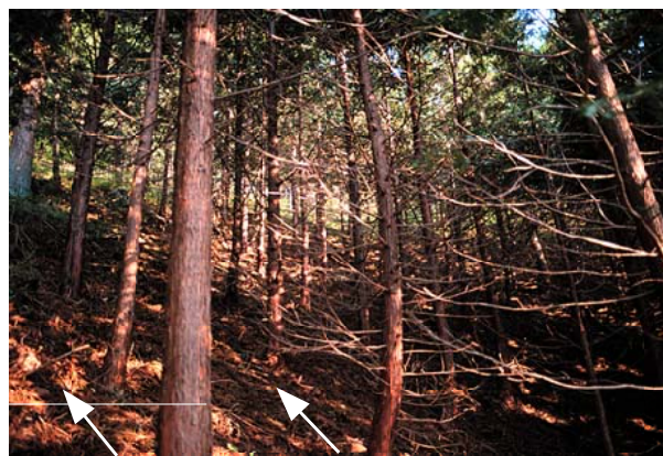
枝打ち区 無処理区

岩手県で漏脂病が発生する10年生になる前から、数年間隔で枝打ち(生枝)を行うことにより、被害が軽減される。