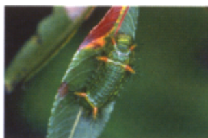
刺されると痛いナシイラガ幼虫

植物の中で強い毒をもつ種類として最も有名なのは、トリカブトでしょう。トリカブトを含むキンポウゲ科の植物は、山菜や薬草として利用されるものもありますが、強い毒性をもつものも多い