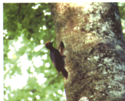
ブナ林のクマガウ

自然保護を考えると、何が大切なのでしょう。書物や専門家の話を聞いて勉強することも大切なことですが、実際に野や山に出かけ、自然を自分の五感を使って確かめることに勝るものはないでしょう。そして夏は、野生の生物たちを観察するのに最適な季節です。まず、自然と付き合ってみることから始めませんか。今回のテーマ展が、そのお手伝いをします。