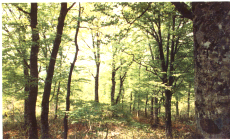
豊かな自然を象徴するブナ林