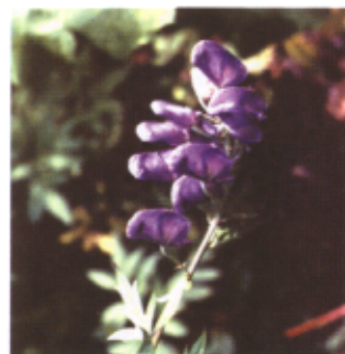
猛毒のオクトリカブト