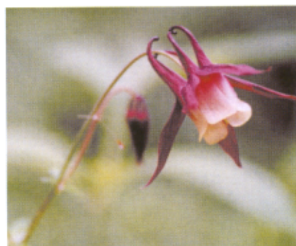
雑木林の花 ヤマオダマキ

まずは最も身近な、町や里の花たち。ここではピロードモウズイカやオオハンゴンソウ、オオマツヨイグサなどの帰化植物が幅をきかせています。