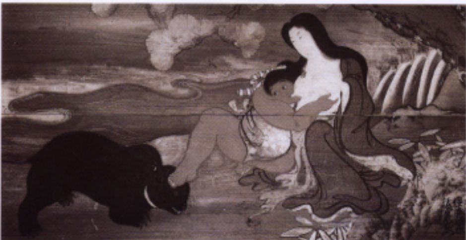
山姥の絵画（岩手県上閉伊郡宮守村の塚沢神社）

この聖・俗のリーダー、一方は藩祖・信直公出生地・一方井の寶積寺に今日まで法脈を保持し人々を教化し、一方は英邁なる藩主として今日なお現代世界を動かすエネルギーを秘めているのです。