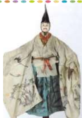
はっけん あわじにんぎょう 発見された淡路人形 の1つ(当館蔵)

これらは当時、淡路の国(現在の兵庫県)のあやつり師(あやつり人形を操作などする人)が、遠く盛岡までやってきて人形芝居をしたことを示すたいへん貴重な資料です。