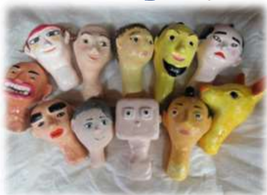
ひか 光る こせい 個性の にんぎょうかしら 人形頭 たい 11体

この にんぎょうかしら 人形頭の も 持ち方は かた 【ハサミ しき 式】という方式で、 ほうしき 人形の くび 首の部分 なかゆび を ひとさ 中指と ゆび 人指し指には うご さんで動かす よ。 とうぶ 頭部の あな 穴に ちよくせつゆび 直接指を入れる タイプの しゅかんしき 【首管式】の ゆびにんぎょう 指人形とは ちがうので て 手に と 取って ため 試してみてね。