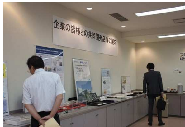
成果品展示(企業の皆様との共同開発品等)