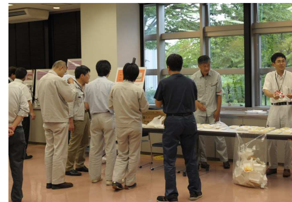
成果品展示(「銀河のちから」パスタ試食)