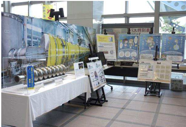
ILCの紹介(超伝導加速空洞)