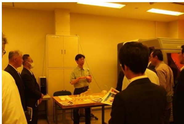
所内見学(3次元プリンター、光造形装置)