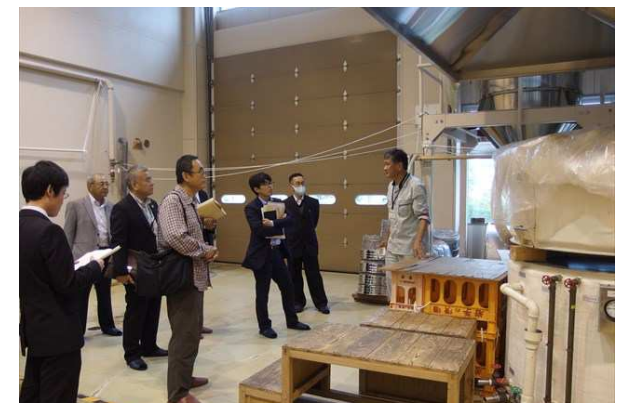
所内見学(醸造食品実験棟)