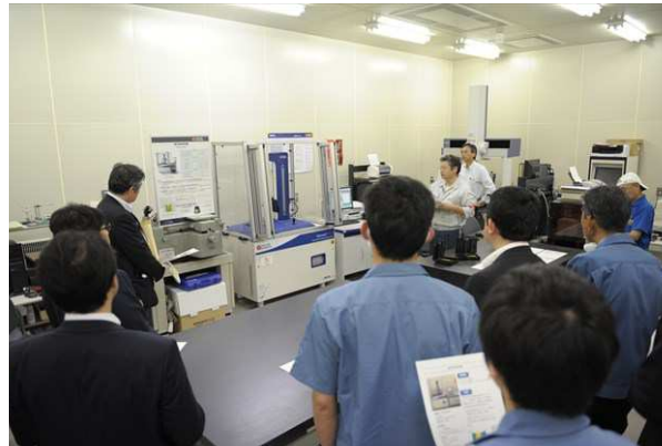
所内見学(真円度測定機)