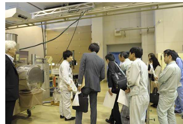
所内見学(スプレードライヤー)