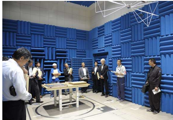
所内見学(電波暗室)