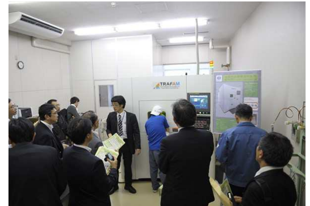
所内見学(金属粉末積層造形装置)