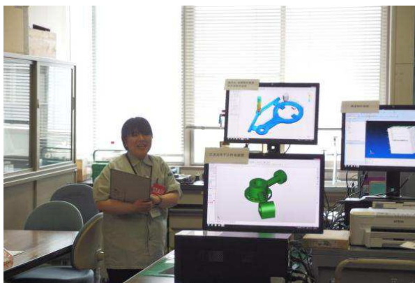
所内見学会(鋳造用湯流れ・凝固解析)