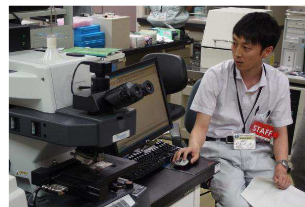
所内見学会(フーリエ変換赤外分光装置)