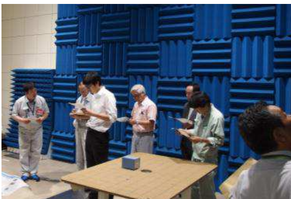
所内見学会(電波暗室)