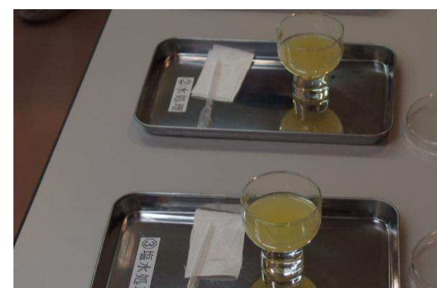
成果品展示(ユズエキスの試飲)