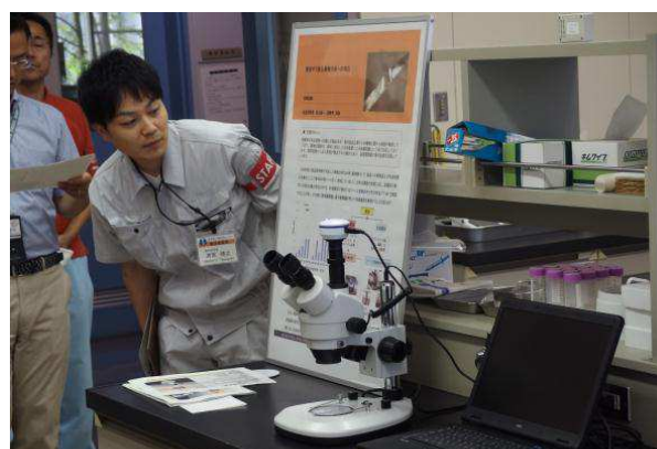
所内見学会(実体顕微鏡)