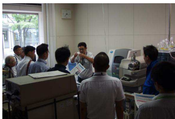
所内見学会(キャピラリー電気泳動システム)