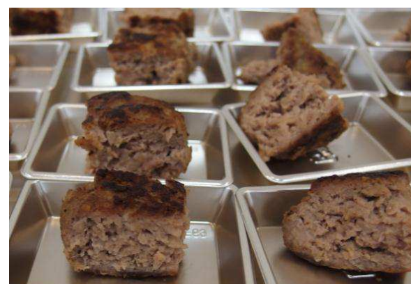
成果品展示(オール岩手の塩麹ハンバーグ試食)