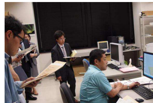
所内見学会(金型表面デザインCAD/CAMシステム)