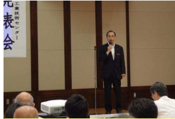
主催者挨拶(理事長)