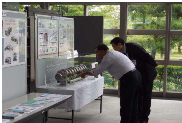
ILCの紹介(超伝導加速空洞)