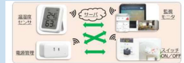
DX活用システム構築例

県や工業技術センターのDXに対する取り組み、DX推進特命部の業務内容、DX支援内容、研究業務及び貸出機器等についてご紹介します。