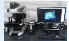
非接触3D形状測定器