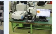
顕微赤外分光分析装置