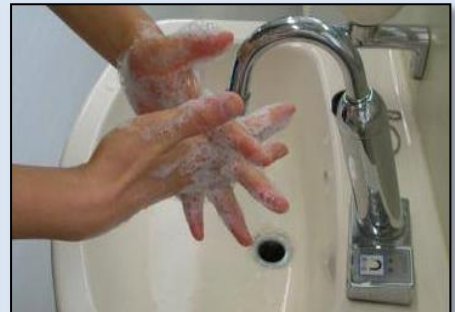
⑤ 指の間もよく洗う