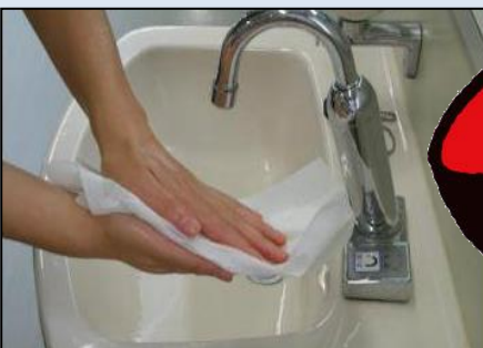
⑩ パーパータオルなどで拭く