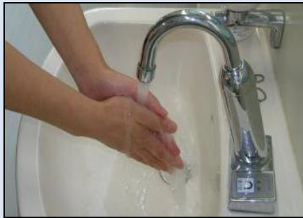
① 手指を流水でぬらす