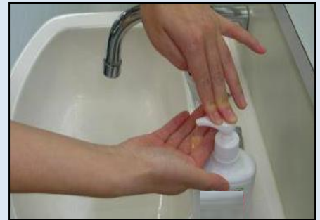
② 石けんを手のひらにとる