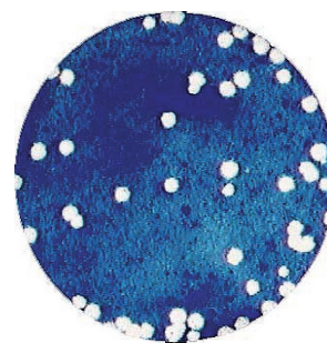
図3. Vero細胞で形成されたチクングニヤウイルスのプラーク

血清診断ではIgM捕捉ELISAによるIgM抗体の検出を行う。急性期に比べ回復期における特異中和抗体価上昇によっても診断可能である。チクングニヤウイルスに感染したVero細胞は、4日程度で明瞭なプラークを形成する( 図3 )ので、プラーク減少法による中和抗体測定は比較的迅速に測定できる。