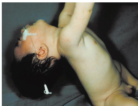
図1. 乳児ボツリヌス症での筋肉の弛緩

出生後順調に発育していた乳児が便秘傾向を示す。大半の患者は便秘状態が数日続き、全身の筋力が低下する脱力状態( floppy )になり、ほ乳力が低下し泣き声が小さくなる。特に、顔面は無表情となり、頸部筋肉の弛緩により頭部を支えられなくなる( 図1 )。眼瞼下垂、瞳孔散大、対光反射が緩慢になるなど、ボツリヌス食中毒と同様な症状が認められる。また、頑固な便秘のために、便から長期間( 1~2カ月 )菌が排泄される例も珍しくない( 図2 )。