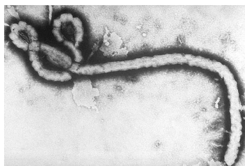
図2.( 米国CDC Fred Murphy博士より )

エボラウイルスはマールブルグウイルスと共にフィロウイルス科( Filoviridae ) に属する。短径が80 ~ 100nm、長径が700 ~ 1,500nmで、U字状、ひも状、ぜんまい状等多形性を示す( 図2 ) が、組織内では棒状を示し、700nm前後のサイズがもっとも感染性が高い。スーダン株とザイール株との間には生物学的にかなり差がある。たとえば、 in vitro での細胞培養( Vero細胞 ) で、スーダン株はあまり強い変性を示さないのに対し、ザイール株は急速に細胞を変性・壊死にいたらしめる。また、 in vivo でもマウス、サル類での感染性は大きく異なる。ザイール株は極めて強い病原性を示し、速やかに死に至らしめる。病原体は他のVHFウイルスと同様にレベル4に分類されており、ウイルス増殖を伴う作業には最高度安全実験施設( BSL-4あるいはP4 ) が必要である。フィリピンでカニクイサルが発症したときの原因であるレ斯顿株は、ヒトへの病原性はない。