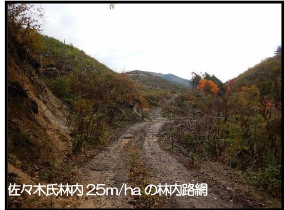
佐々木氏林内25m/haの林内路網