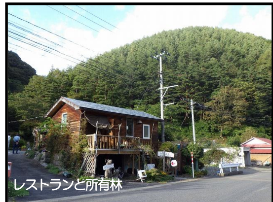
レストランと所有林