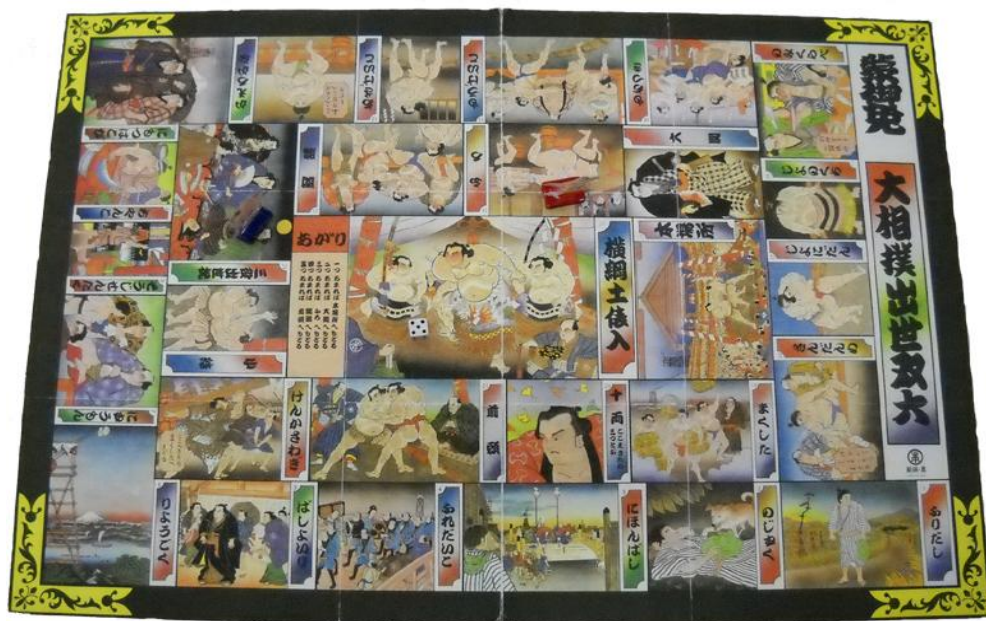
おお ず もう しゅっ せ すごろく 大相撲 出世双六

え すごろく かみすごろく つく じだい うつ かがみ 「絵双六」(紙双六)は、作られた時代を映す鏡といわれます。