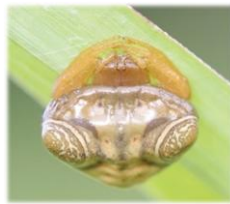
オオトリノフンダマシ