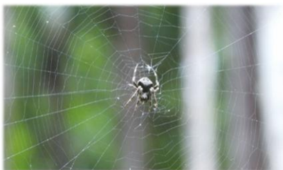
網にとまるオニグモ