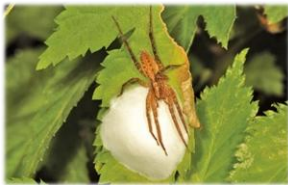
卵のうを守るシボグモ