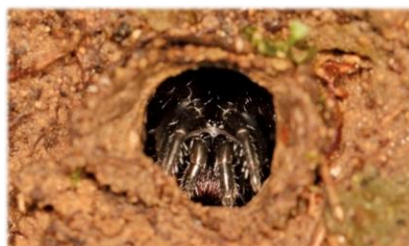
巣穴にひそむカネコトタテグモ