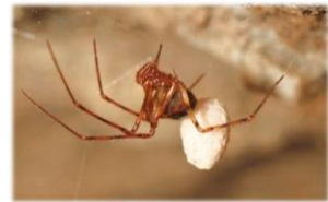
糸いぼに卵のうをつけたアツカホラヒメグモ

クモの寿命 クモの多くは1年未満で死んでしましますが、一部のクモは数年かけて成長し、10年以上生きる種類もいます。