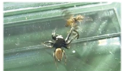
ハエにとびかかるマミジロハエトリ