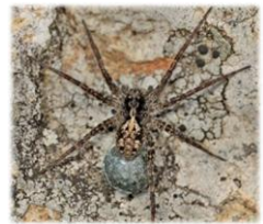
タカネコモリグモ

引用・参考 (1) Japan Spider Catalog (2025) https://sites.google.com/view/japan spiders catalog (参照 2025/10/13) / (2) World Spider Catalog (2025) https://wsc.nmbe.ch (参照 2025/10/13) 他