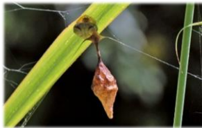
卵のうを守るオオトリノフンダマシ