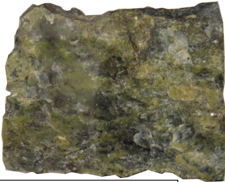
じゃもんがん さいしゆち とおの しみやもりちやういわねばし 蛇紋岩 採取地：遠野市宮守町岩根橋 オルドビス紀 き みやもりがんたい 宮守岩体

宮沢賢治「シグナルとシグナレス」より 蛇紋岩の崖に来て、やっと東が燃えだした。 火花を闇に、撒きながら、 凍えた砂利に、湯気を吐き ガタンコガタンコ、シューフツフツ