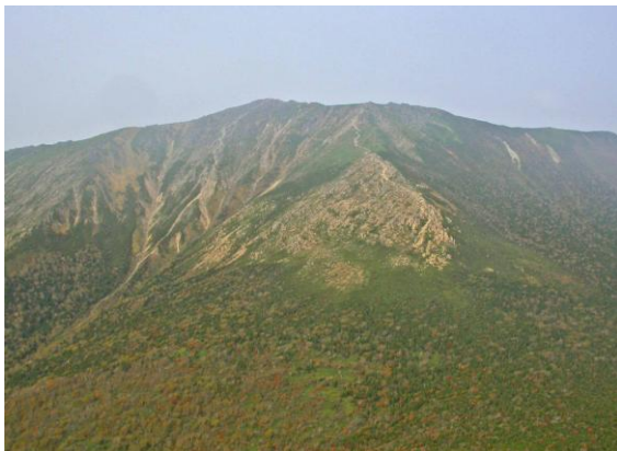
やくしだけ のぞ はやし ねさん 〈薬師岳から望む早池峰山〉

いわて けんない じゃもんがん ぶん ぶ 岩手県内で蛇紋岩が分布しているエリアはいくつかありますが、そのなか