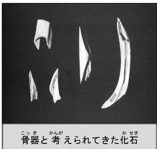
骨器と考えられてきた化石