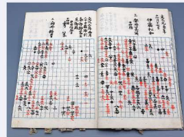
盛岡藩士向井将書と本因坊跡目の秀策との対局記録 写本「連碁并秀和算知打碁」(れんごならびにしゅうわさんちうご) (明治時代)より

■展覧会関連日曜講座 1月26日(日) 講師、内容については県博日曜講座の欄をご参照ください。