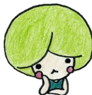
岩手県人事委員会 事務局キャラクター ジンイちゃん