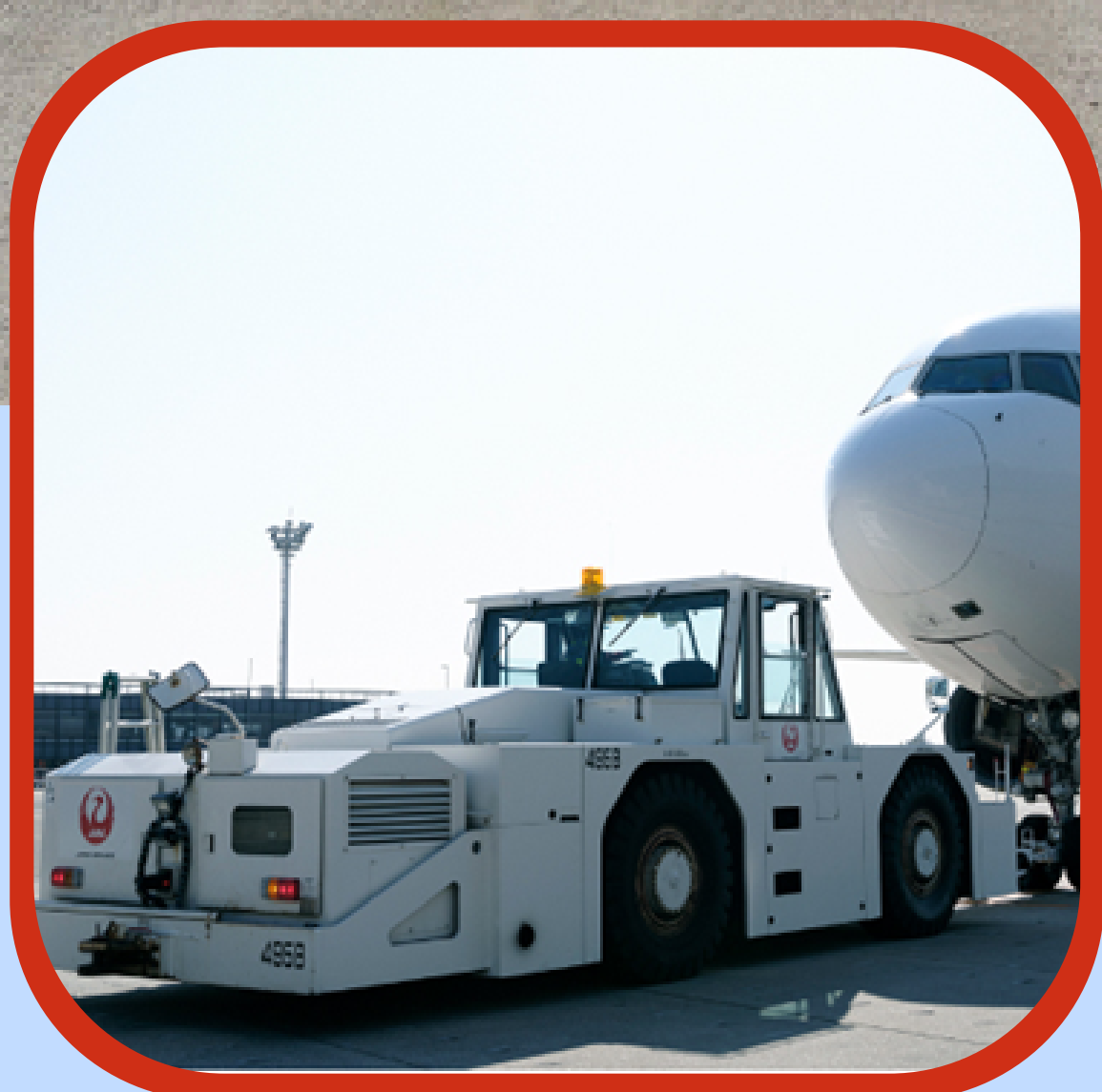
空港特殊車両見学