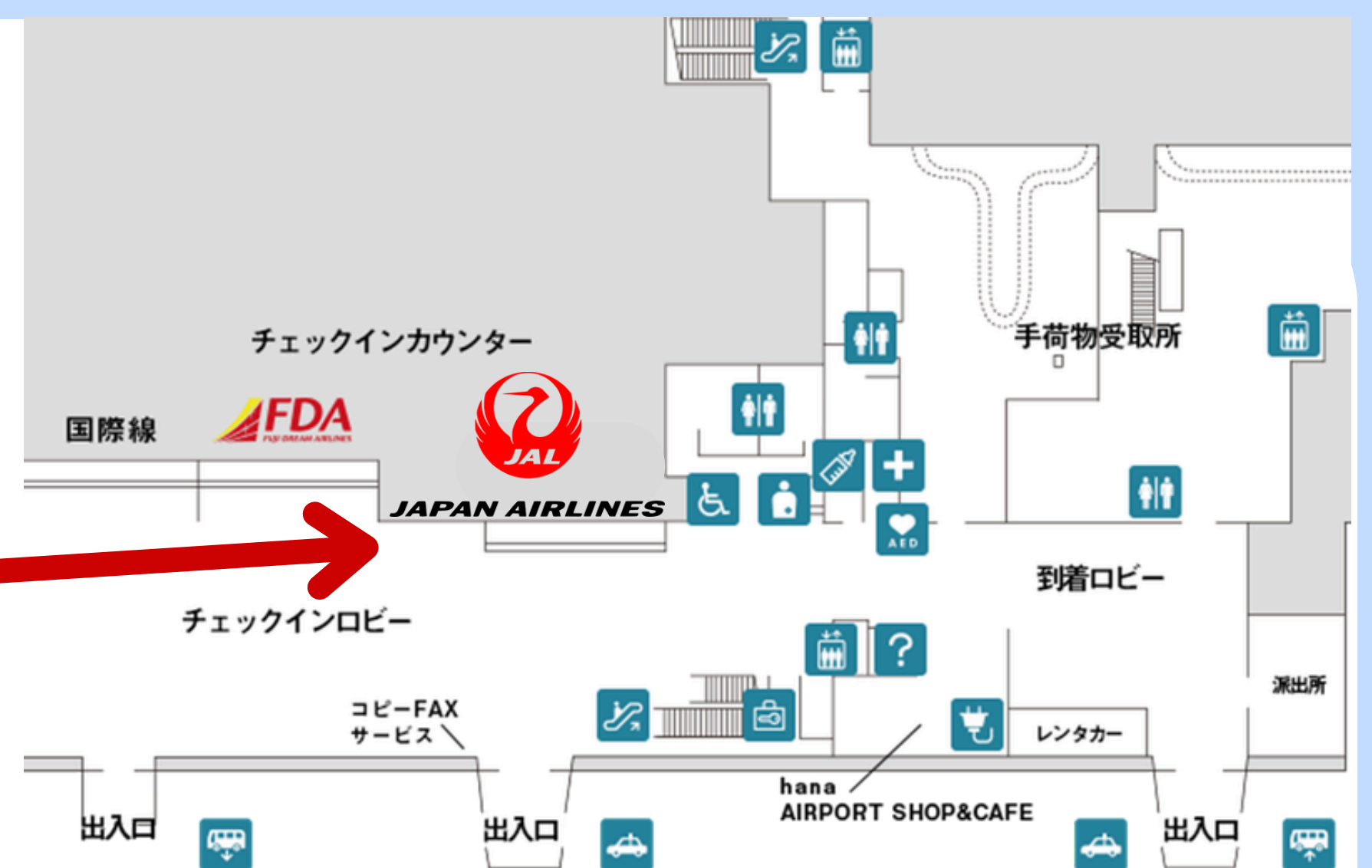
【空港 1 階フロアマップ】

整備士航空教室～飛行機のことなんでも教えます～ 飛行機誘導（マーシャリング）模擬体験 滑走路で飛行機のお見送り 空港特殊車両見学 オペレーションコントロール業務見学