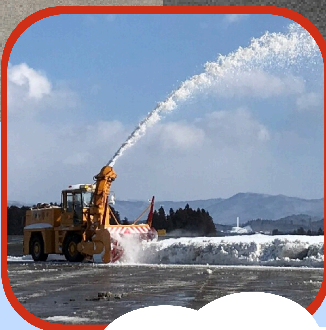
空港で働く車の見学も できるよ！