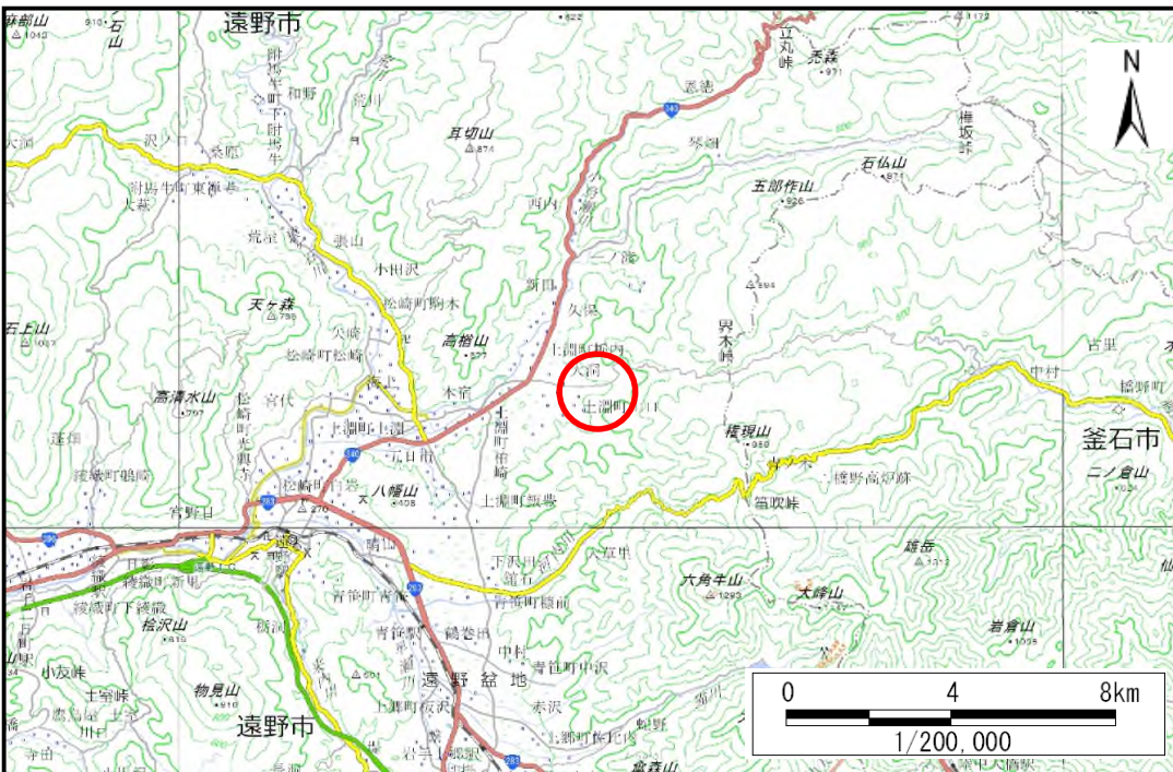
概況図 (S=1 200,000)