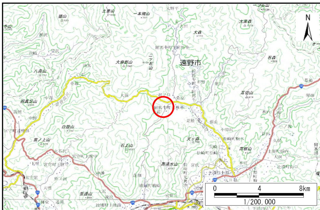
概況図 (S=1 200,000)