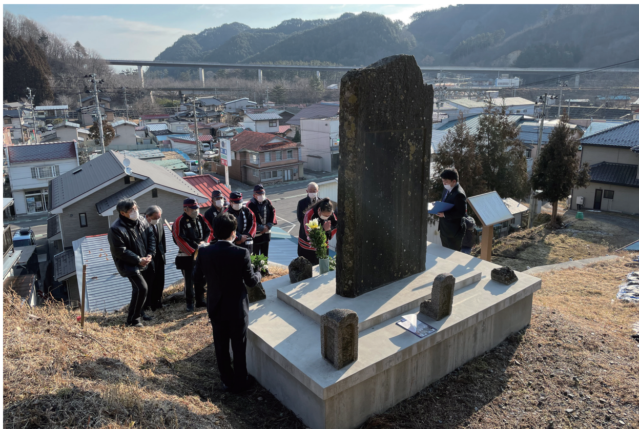
写真 2-4 普代村普代地区における慰霊祭