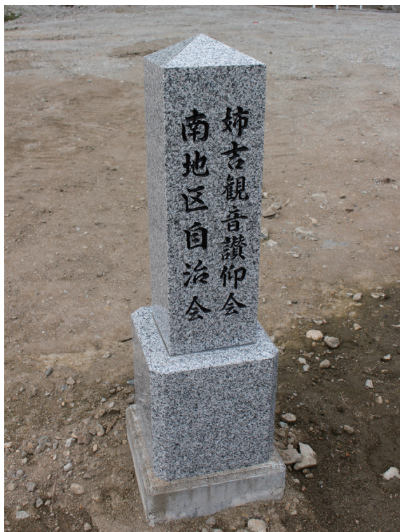
写真2-8 東日本大震災後、姉吉観音讃仰会が建立した津波到達点碑