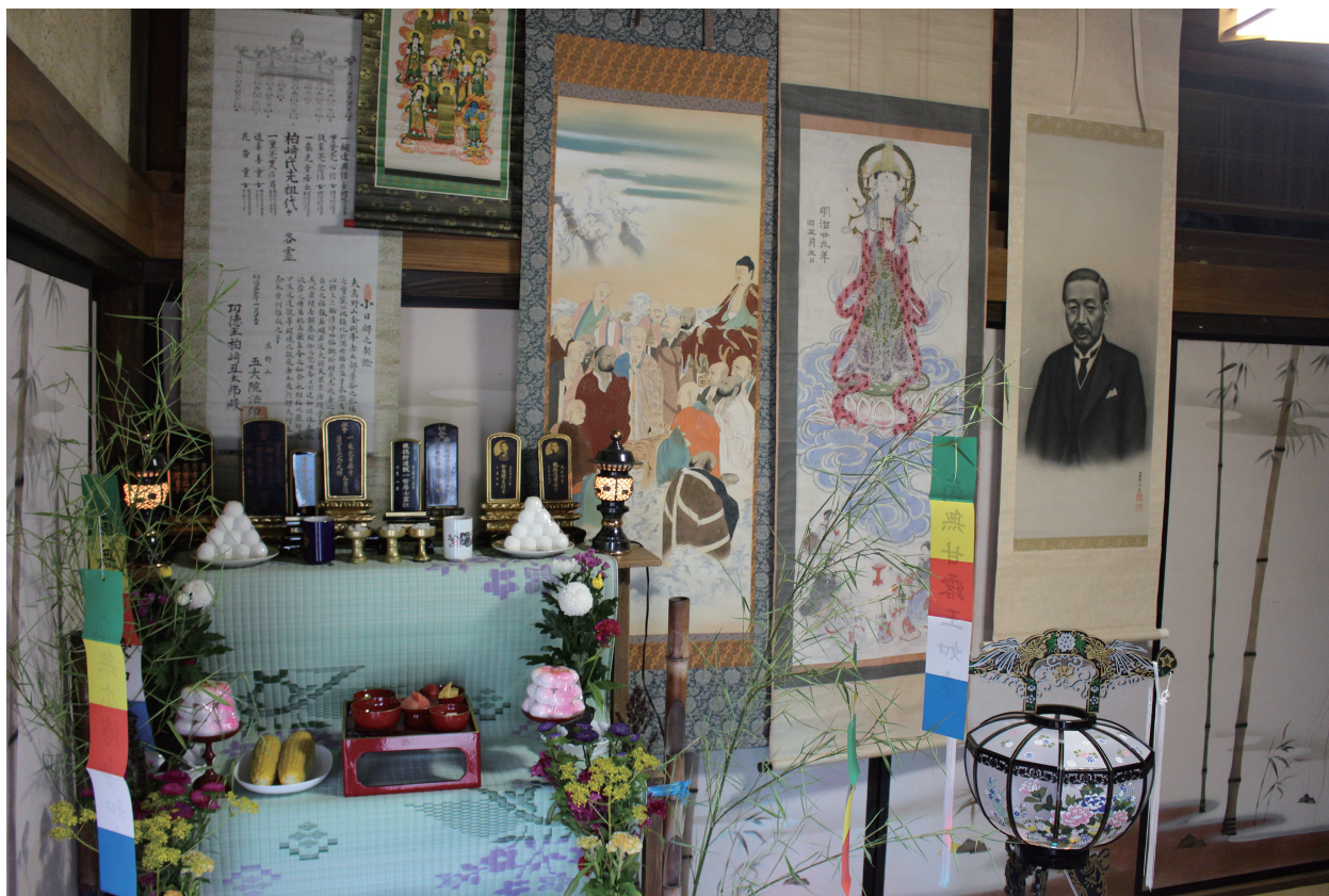
写真2-12 柏崎元村長子孫宅の盆供養の様子