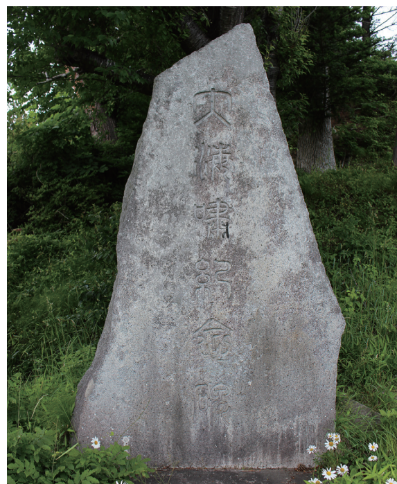
写真1-3 岩手県山田町織笠「大海嘯記念碑」

※「①」～「③」は行論の必要上便宜的に筆者が付したもの。また難読文字にはルビを付している。