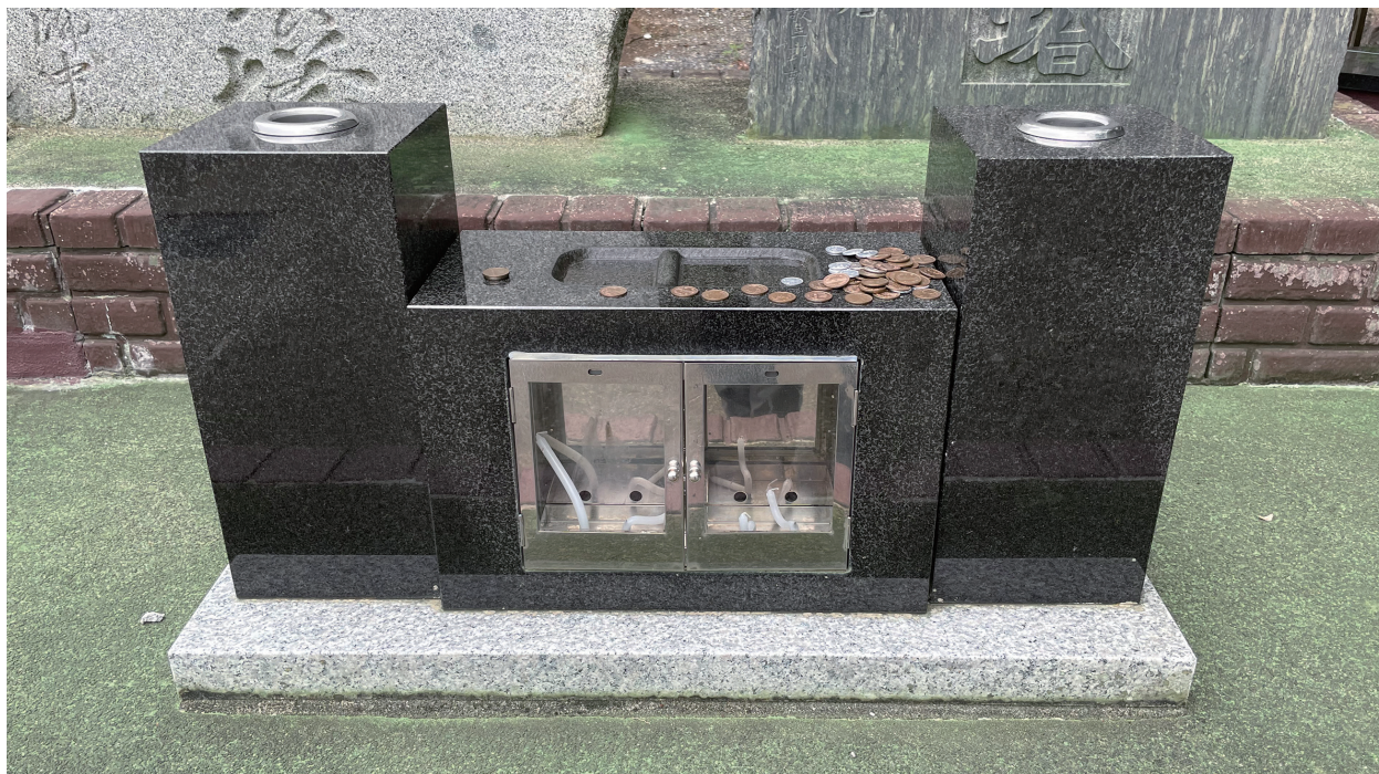
写真4-1 供えられた時期が判然としない例