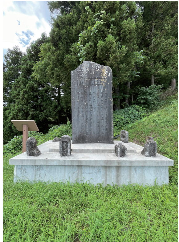
写真 2-2 普代村普代 「大海嘯記念」