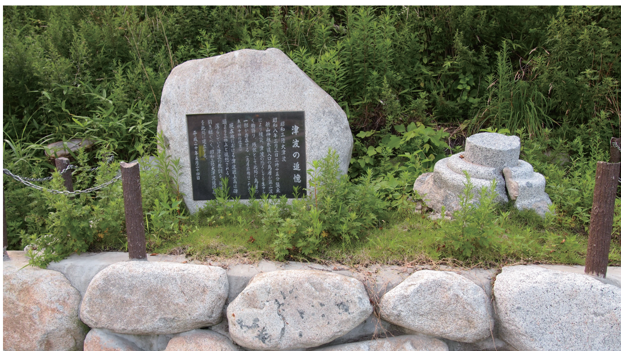
写真2-11 史料2-5のモニュメント(左)と、昭和三陸地震津波で被災した石造鳥居(右)