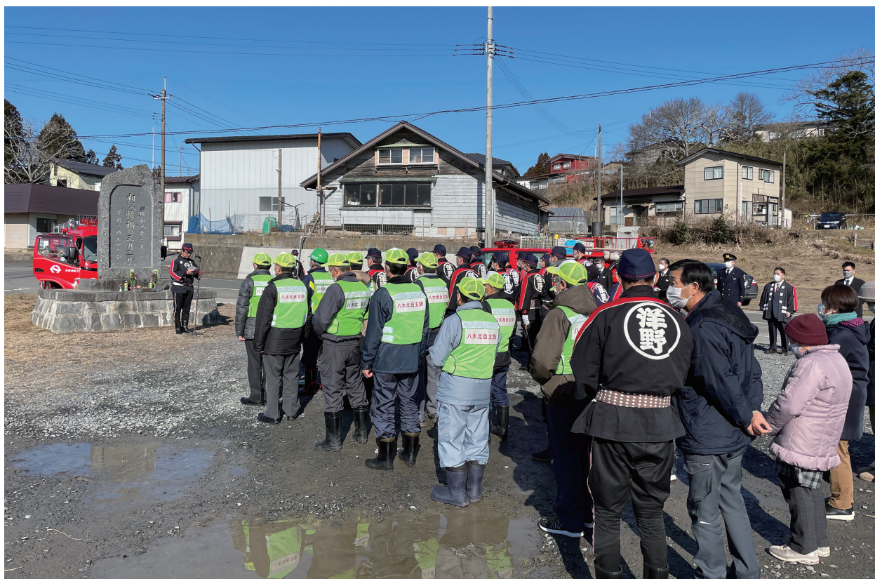
写真 2-5 洋野町種市八木地区における慰霊祭