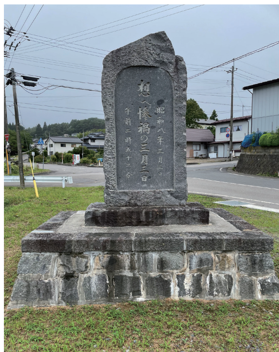
写真2-1 洋野町種市八木 「想へ惨禍の三月三日」