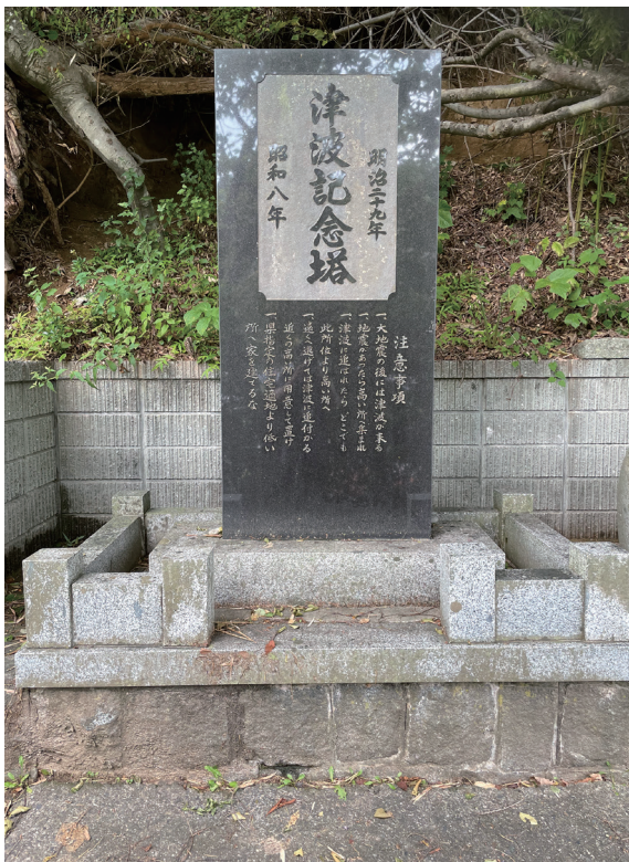
写真 2-3 普代村太田名部 「津波記念塔」

明治二十九年丙申旧五月五日午後八時 大津波襲来普代村の被害流失 家屋七十八戸死者三百四十名負傷者 百五十八名 昭和八年三月三日午前二時三十分上下に 動揺する強震あり続いて三時頃より大音 響と共に大津波の襲来あり三時十分頃 最も被害あり普代村の流失戸数七十八戸 死者百三十五名負傷者八十一名 昭和五十五年八月吉日 下関伊郡普代村太田名部々落建之