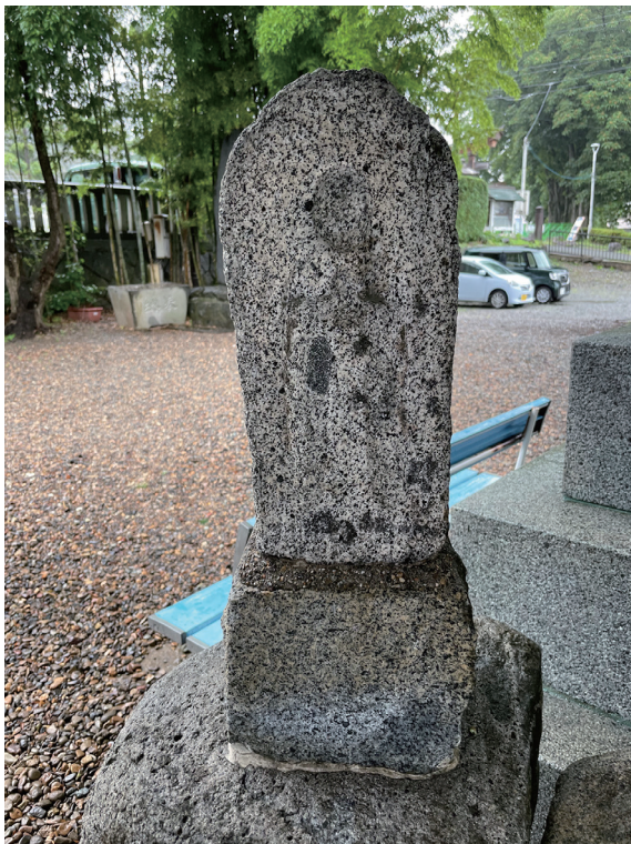
写真1-1 桜山神社 おもかげ地蔵