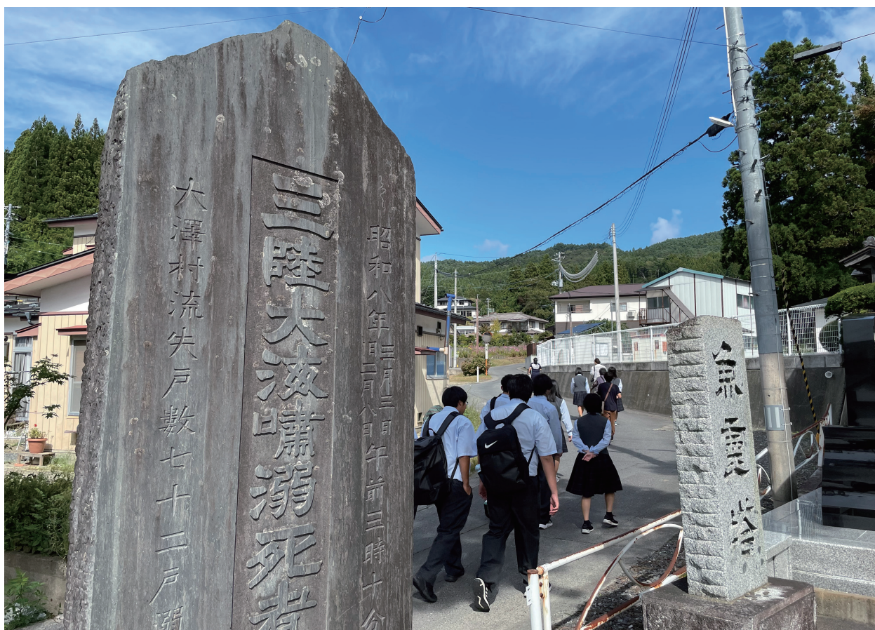
写真4-3 ガイドツアーにおける避難訓練の様相