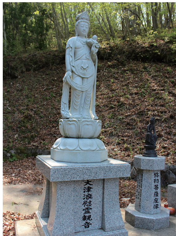
写真2-9 重茂平和公園内に建立された大津浪慰霊観音