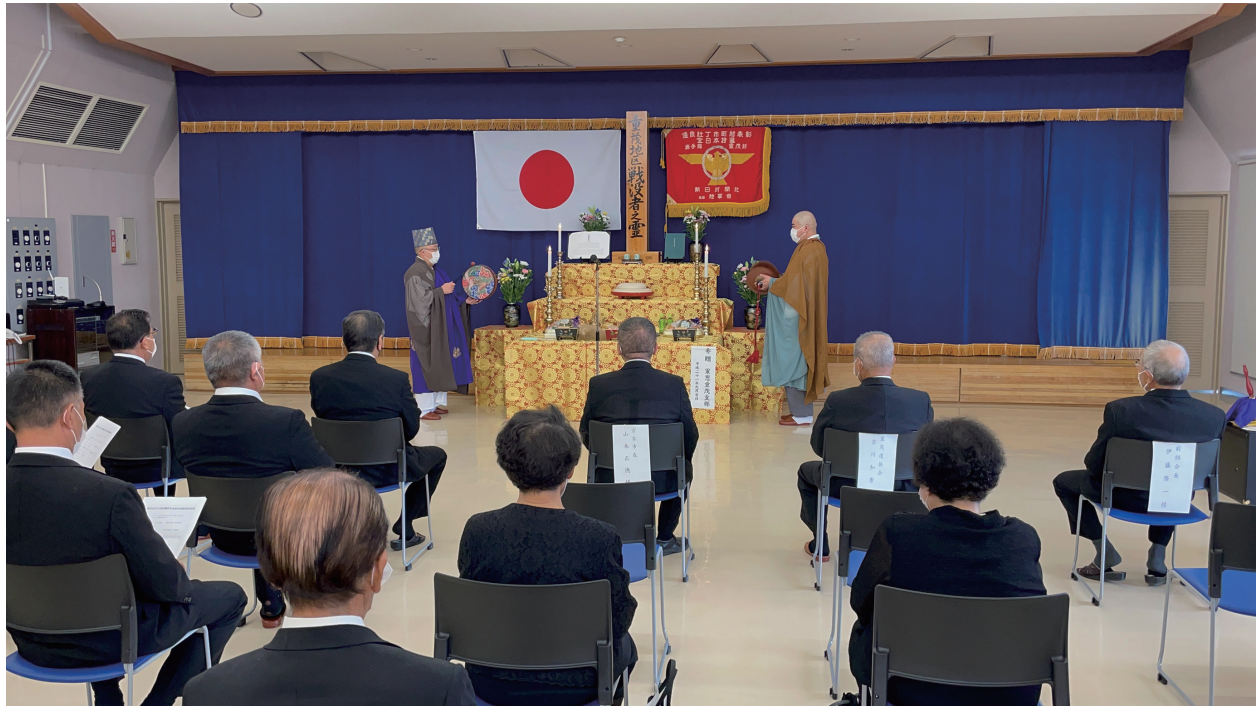
写真 2-10 宮古市重茂地区で行われる「戦争並びに津波犠牲者追悼合同慰霊祭」