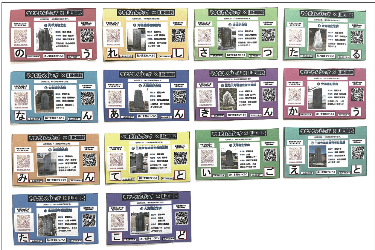
写真 4-4 山田高校校長（2024年度現職）が作成した「津波碑」普及用カード

③について、学校が「地域コーディネーター」を設置し、毎時の授業設計や、地域人材の発掘に専念できる環境を整備したことも、山田高校の「総合的な探究の時間」の円滑な運営に資するものである。また、2024年度の同校校長は、「津波碑」をテーマに掲げた活動開