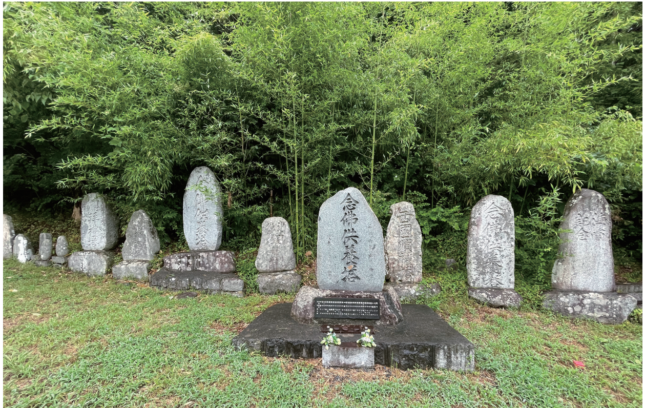
写真 4-2 石碑群全体をまとめて供養する例