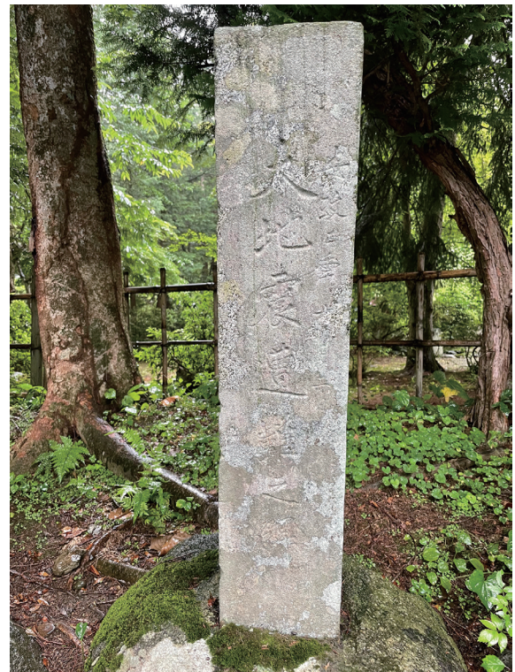
写真1-2 聖寿禅寺 大地震遭難之碑