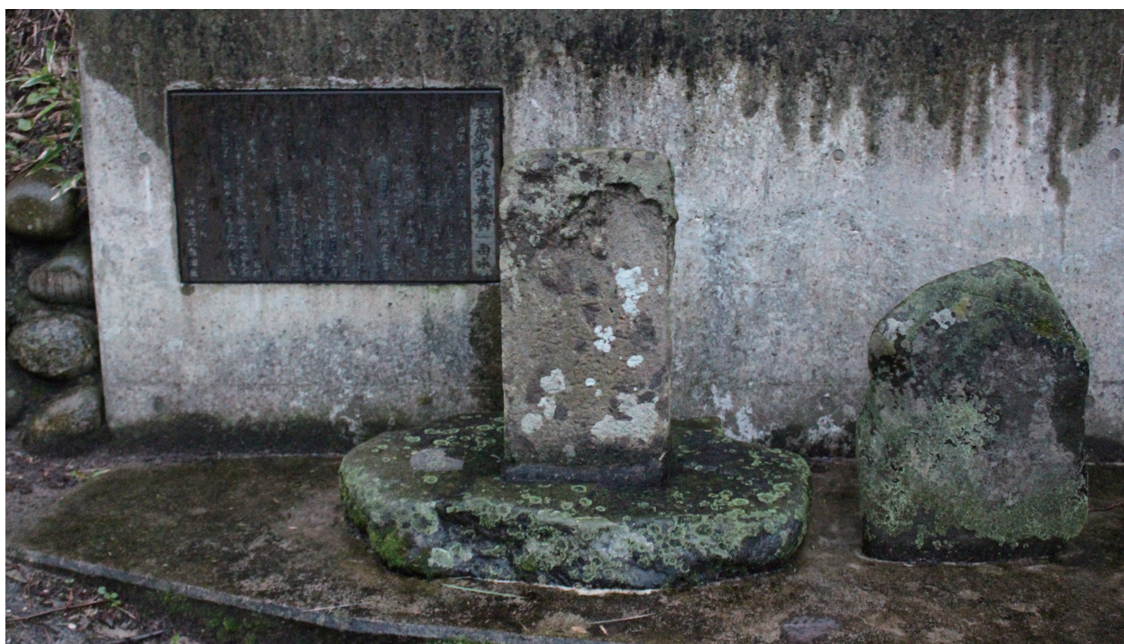
写真4-7 「天保の大津波墓碑」（中央及び右）と、東日本大震災後に設けられた由来碑（左）

現地調査を行った結果、宮城県東松島市の事例と同様、伝承の対象となる碑と隣接して新たなモニュメントが設けられていた（写真4-7）。碑文を以下に掲げる。