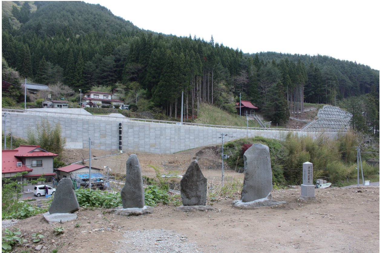
写真1-5 宮古市川代集落内に設置された後、移設された東日本大震災津波到達点碑（右端）

個々の津波モニュメントが地域に根差し、伝世するものである以上、その扱いについては所在地域の住民の意思が最優先されるべきと考える。しかしながら、津波モニュメントが、あるいはそれを媒介として紡がれる災害伝承が適切に機能を果たすためには、こうした移動履歴をもできる限り正確に記録し、モニュメントそれ自体とともに後世に伝える必要があることもまた、言を俟たないであろう。