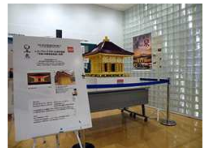
レゴブロックで作ったミニ金色堂