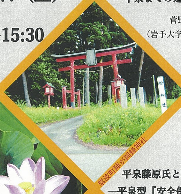
紫波町陣ヶ岡峰神社