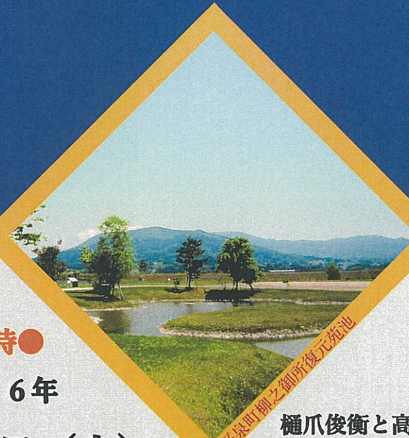
平泉町柳之御所復元苑池