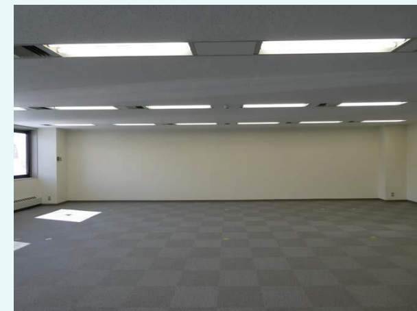
※貸室イメージ (他区画)