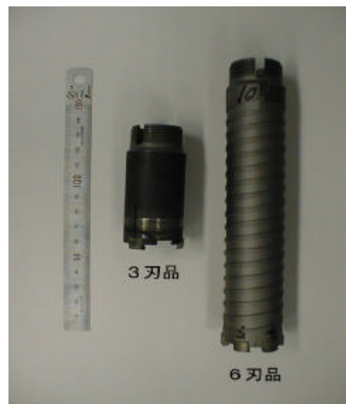
図1は、ダイヤモンド結晶粒径とコンセントレーションの関係調べた。

そこで、ダイヤモンド結晶粒子の粒径とコンセントレーションを変化させたメタルボンドダイヤモンドセグメントを焼結により作成し、抗折荷重を測定することにより穿孔速度を向上させるために最適なダイヤ