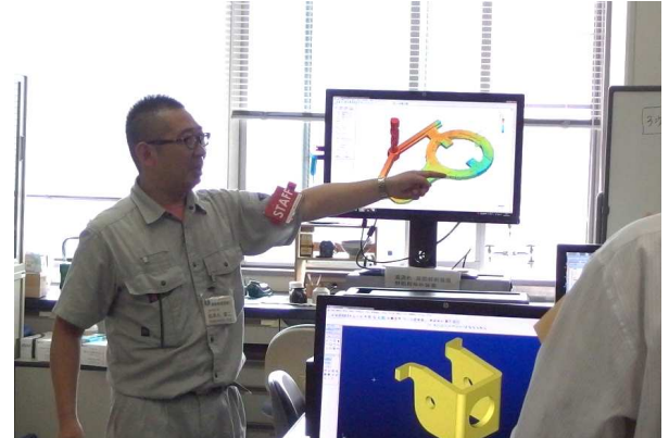
所内見学会(鑄造用湯流れ・凝固解析)