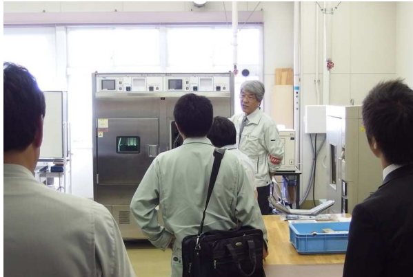
所内見学会(促進耐候性試験機)