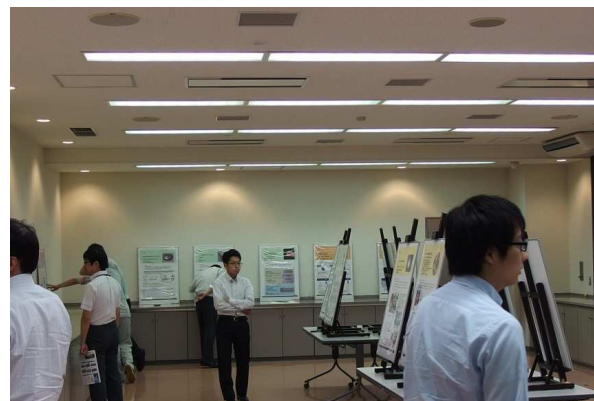
成果ポスター展示会場