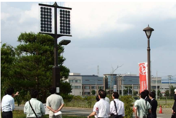
所内見学会(ソーラーLED街路灯)