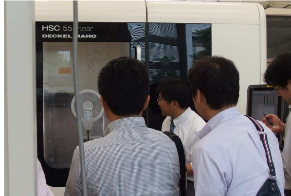
所内見学会(5軸マシニングセンタ)