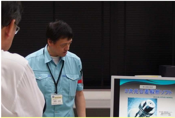
所内見学会(3次元公差解析ソフト)