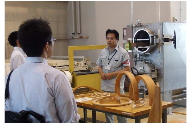
所内見学会(コンウッドシステム)