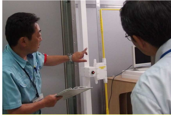
所内見学会(電源周波数磁界イミュニティ試験器)