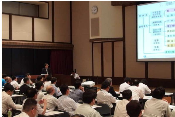
業務説明(副理事長)