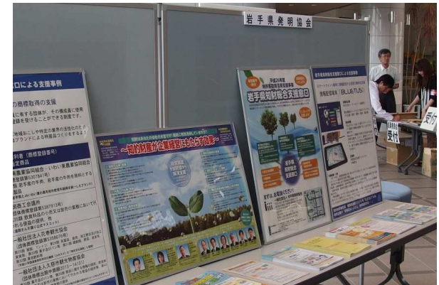
関係機関のポスター展示