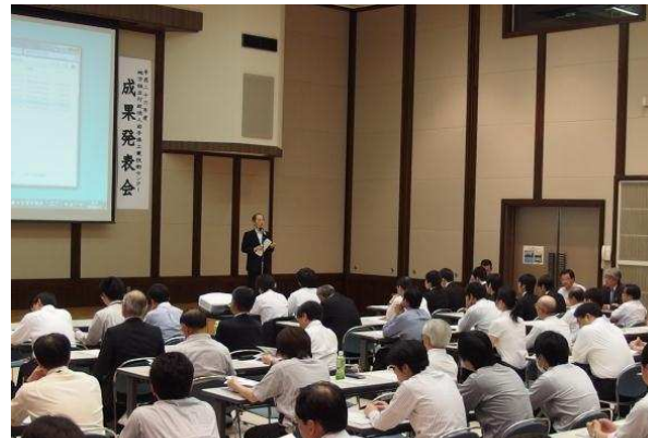
主催者挨拶(理事長)