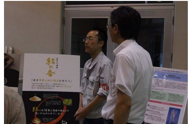
所内見学会(食品醸造実験棟)