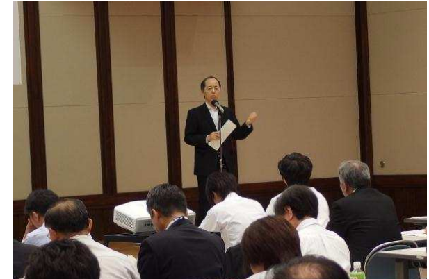
主催者挨拶(理事長)