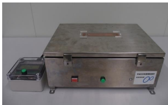
塩蔵わかめ水分量・塩分量測定器