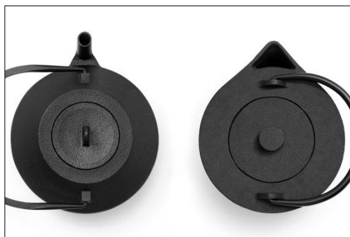
フィンランドデザイナーと開発した商品 (iwatemo)

休憩時間（13:50～14:20、15:10～15:30）には担当者がご質問などにお答えします。