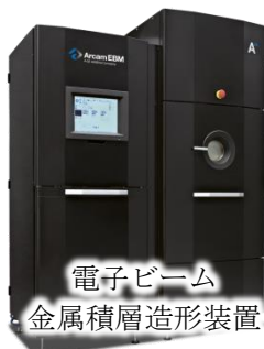
電子ビーム 金属積層造形装置