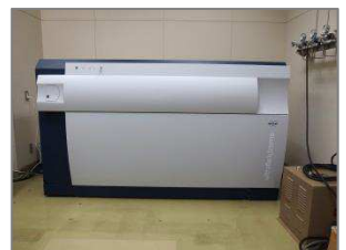
MALDI飛行時間型質量分析装置(本館に設置)