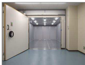
シールドルーム(3室)