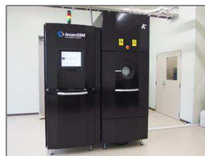
電子ビーム積層装置