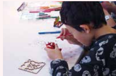
レーザー彫刻機を使った小木工づくり