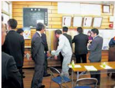
企業見学会の開催

県内の民間企業・団体等を構成会員とし、関連する技術分野の発展に寄与することを目的とした研究会の活動を支援しています。