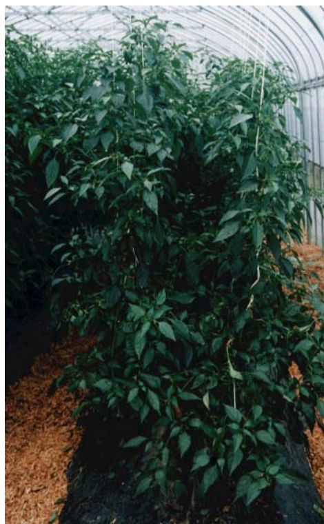
写真1 半放任型2本仕立法の草型

時期別収量をみると、4本仕立法に比べて初期収量の低下が見られず、収穫期間全体をみても同程度の収量となる。