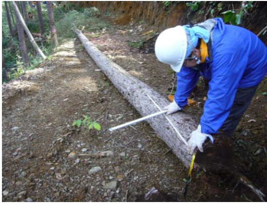
写真-1 伐倒後の樹高測定の様子