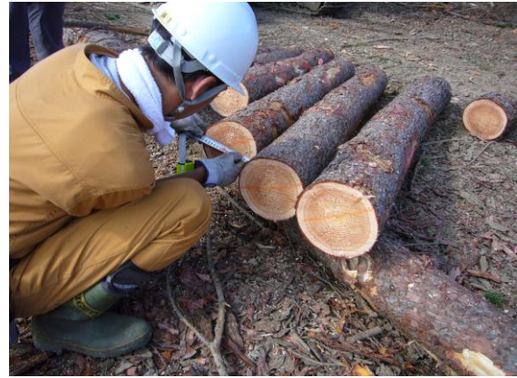
写真-2 直径測定の様子