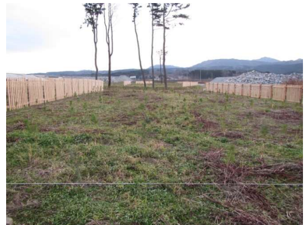
写真 調査箇所の状況（Pブロック）