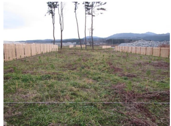
写真 調査箇所の状況（Pブロック）

植栽基盤土壤の物理性及び化学性の調査結果を表に示しました。化学性では、ECが低く養分不足と評価されましたが、造成緑化地のECは低いのが通例で、問題は少ないとされています 3) 。物理性では、Pブロック(写真)で土壤に粘土やシルトが多く、固結層が確認された測点(1測点/3測点)や、透水性が不良と評価された測点(2測点/3測点)がありました。Pブロックについては、今後の植栽木の生存や成長を注視する必要がありますので、Aブロックとともに継続して植栽木の調査を行います。