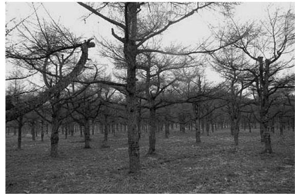
写真-2 千貫石採種園

新三系中新統の各種堆積岩が基底をなしているが、上部は砂礫層によっておおわれ、その上部には粘土、火山灰の堆積が見られる。②土壌は地形により赤黄色土壌と擬似グライ土壌に2分され、さらに擬似グライ土壌は粘土質母材と砂礫質母材のものに由来し、赤黄色土壌～擬似グライ土壌～擬似グライ土壌(礫型)が局所地形に対応して現れる土壌カテナを形成