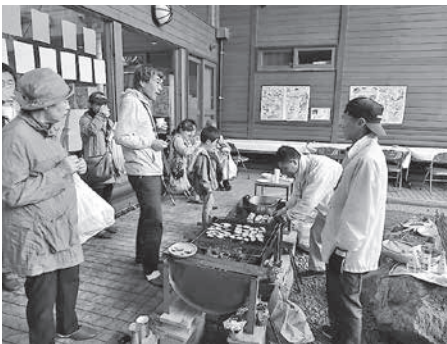
炭火で焼いた岩手の食材はいかが

多くの森林に囲まれたこの岩手で、自然とふれあい、森林・林業に親しみながら、さわやかな秋の一日を過ごしてみませんか？ 職員一同、皆様のご来場をお待ちしております。