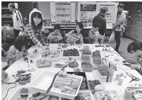
木の実などを活用した工作

また、岩手の林業の担い手を育成するため昨年度開講した「いわて林業アカデミー」では、アカデミーのPRなど、研修生も趣向を凝らして準備を進めています。