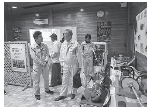
いわて林業アカデミーのPR

また、岩手の林業の担い手を育成するため昨年度開講した「いわて林業アカデミー」では、アカデミーのPRなど、研修生も趣向を凝らして準備を進めています。