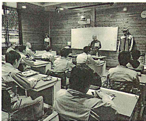
専用教室で林業の基礎を学ぶ

2 林業の基礎知識や技術を学ぶ アカデミーは、林業を知らない人でもしっかり林業を学ぶことができよう研修体系となっており、4月は林業の基本中の基本を学ぶカリキュラムとなっています。