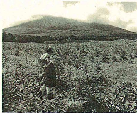
下刈実習、暑い！暑い！

7月の3日間の就業体験研修では県内10の林業事業者体に研修生を受け入れていただきました。研修後は、就業に対する意識が明らかに変わり、研修生の今後の成長が楽しみです。