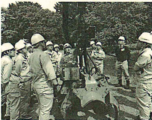
伐木等機械の運転業務特別教育

4 資格を取得し、現場で活躍 アカデミーでは、就業後、速やかに現場で活躍できるよう、多くの資格を取得できます。また、当センターには多くの林業機械がありますので、たくさん練習ができるようになっていきます。