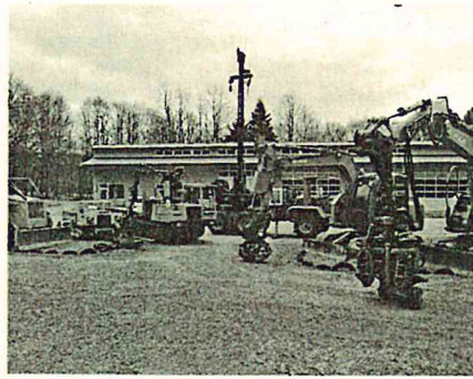
当センターの林業機械 左からスキッドダ、不整地運搬車、フォワーダ、 タワーヤーダ、スイングヤーダ、ハーベスタ

4月後半から8月下旬にかけて段階的に9種類すべての資格を取得し、秋以降の現場での実習に備え、また、就業体験先でも様々な研修ができるようにしています。取得した資格が自分のスキルとして身につくよう、実習を重ねていくことで、現場で活躍できる担い手を育成していきます。