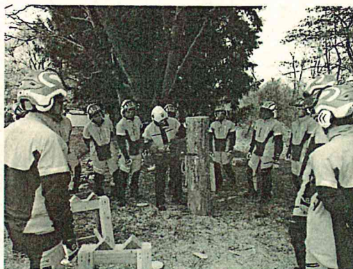
充実した装備で安全に実習を行う

講義では、林業の使命や歴史、森林を育て利用する作業の基礎知識を学び、安全衛生面では、安全作業に必要な服装や森林・林業に潜む危険と対策を学びました。