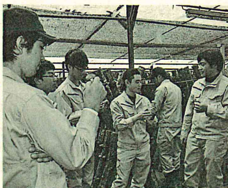
シイタケってめんこいなあ

4 資格を取得し、現場で活躍 アカデミーでは、就業後、速やかに現場で活躍できるよう、多くの資格を取得できます。また、当センターには多くの林業機械がありますので、たくさん練習ができるようになっていきます。