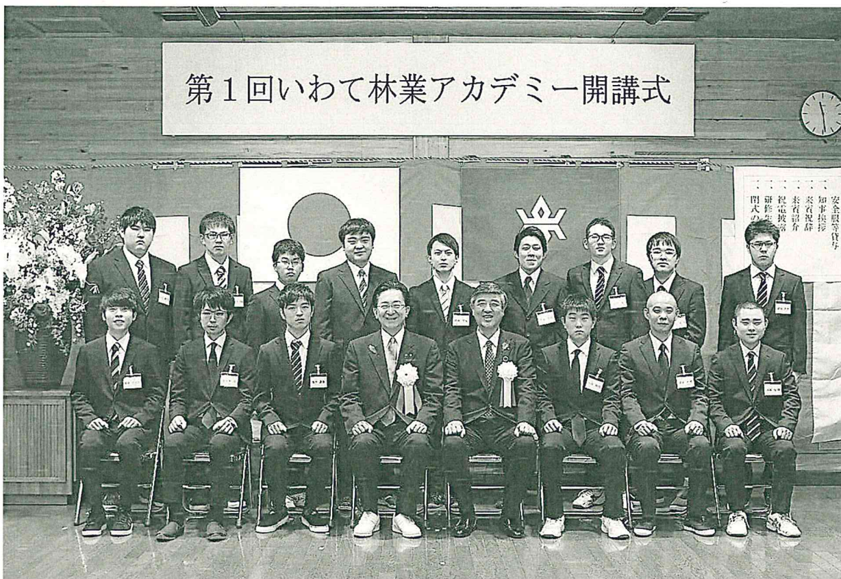
達増知事（中央左）と赤澤林業技術センター所長（中央右）を囲んで記念撮影するいわて林業アカデミー第1期生15人

また、赤澤所長は、「研修生は、優秀な人材がそろっており、岩手の林業の将来を必ずや担ってくれるものと確信しております。第1期生は林業への大きな希望を持っており、私たちが一人ひとりの研修生の夢の実現のために協力していきたいと考えて