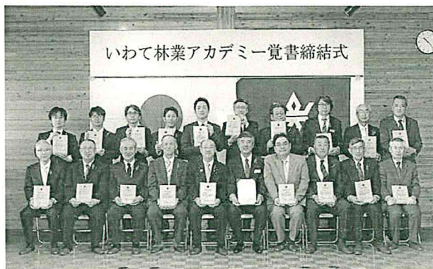
岩手県林業技術センター研修部