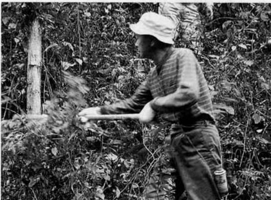
日々の手入れが重要