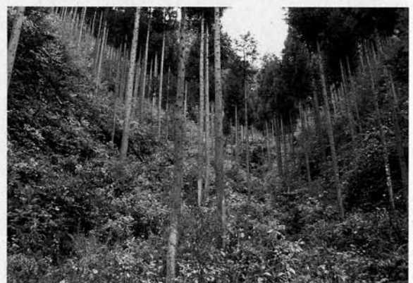
枝打ちの行き届いた森林