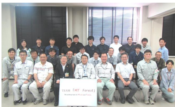
平成30年度 Team MY forest 集合写真

森林施業の集約化により、森林の面的まとまりを確保する森林経営計画について、作成から認定までの流れと、それに関わる森林施業プランナーの役割を、森林総合監理士が説明しました。また、新たな森林経営管理制度と森林環境譲与税についても概説しました。