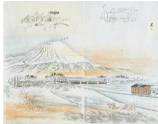
そのころの盛岡駅付近のようす。いまとはぜんぜんちがいます。

大津波と三陸の生き物展 おおつなみ さんりく い ものてん おおつなみ おお さんりく 大津波が起きる前、三陸の海辺にはどんな生き物がいたのでしょうか。大津波で受けた影響と、今のようすを紹介いたします。展示は2月26日まで。