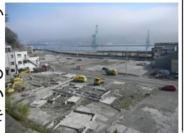
4 月 25 日撮影 釜石市

発災から 1 年以上が過ぎ、被災地では、発災直後に発生したぐれきの仮置場への搬入が概ね完了し、その計画的な処理も進みつつあります。復興の道のりは険しいと思われませんが、岩手県民、心をひとつに「ふるさと岩手・三陸の再建、再生」を果たすよう、一步一步進んでいきます。そんな岩手の今を御紹介します。