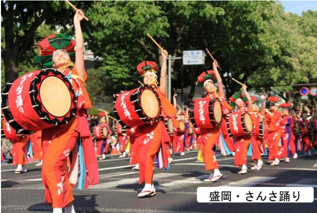
盛岡・さんさ踊り

天候にも恵まれ、県内外から訪れた方々は2日間合わせて24万3千人。この盛り上りを復興への力にかえていきます。