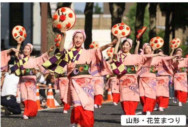
山形・花笠まつり