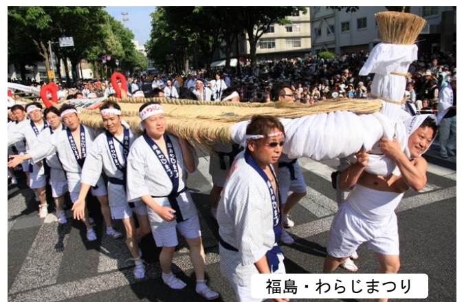
福島・わらじまつり