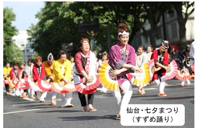
仙台・七夕まつり (すずめ踊り)