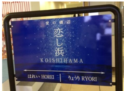
三陸鉄道「恋し浜」駅を再現