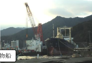
写真右：海に下ろされた貨物船

この日の作業でおよそ7か月ぶりに海に下ろされた「アジアシンフォニー」は、今後、修復のため広島県内の造船所に向かうとのことです。