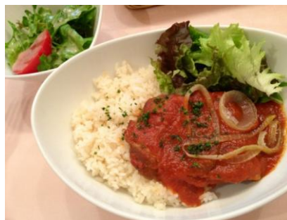
岩手県産ほろほろ鳥のトマト煮込みDON