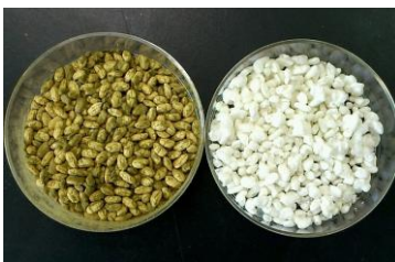
オリジナル麹菌の種麹(左)と米麹

岩手県酒造組合と県工業技術センターは10月24日、県独自の麹菌を初めて開発したと発表。県産のコメや水、酵母と合わせた「オールいわて清酒」の来春の販売を目指しています。