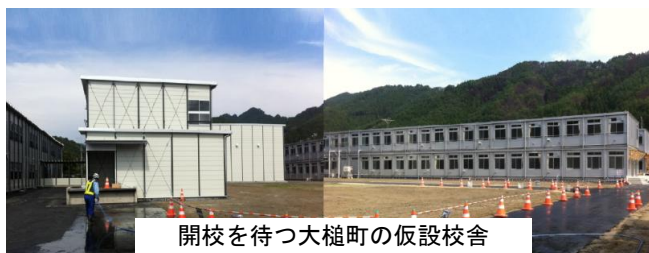
開校を待つ大槌町の仮設校舎

大槌町では、震災の被害で使えなくなった学校の仮設校舎が整備され、開校式を間近に控えています。