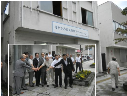
復興ステーションと開所式に出席した 構成団体と協力団体の代表

9月1日、北上市に被災者支援と被災地復興支援の拠点となる「きたかみ復興ステーション」が開所しました。沿岸と内陸の結節点となっている同市の地理的特徴をいかし、被災者の支援に取り組む拠点が北上駅前に設置されたものです。