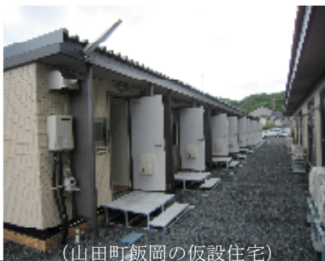
(山田町飯岡の仮設住宅)